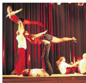
Viel Applaus für Akrobatik