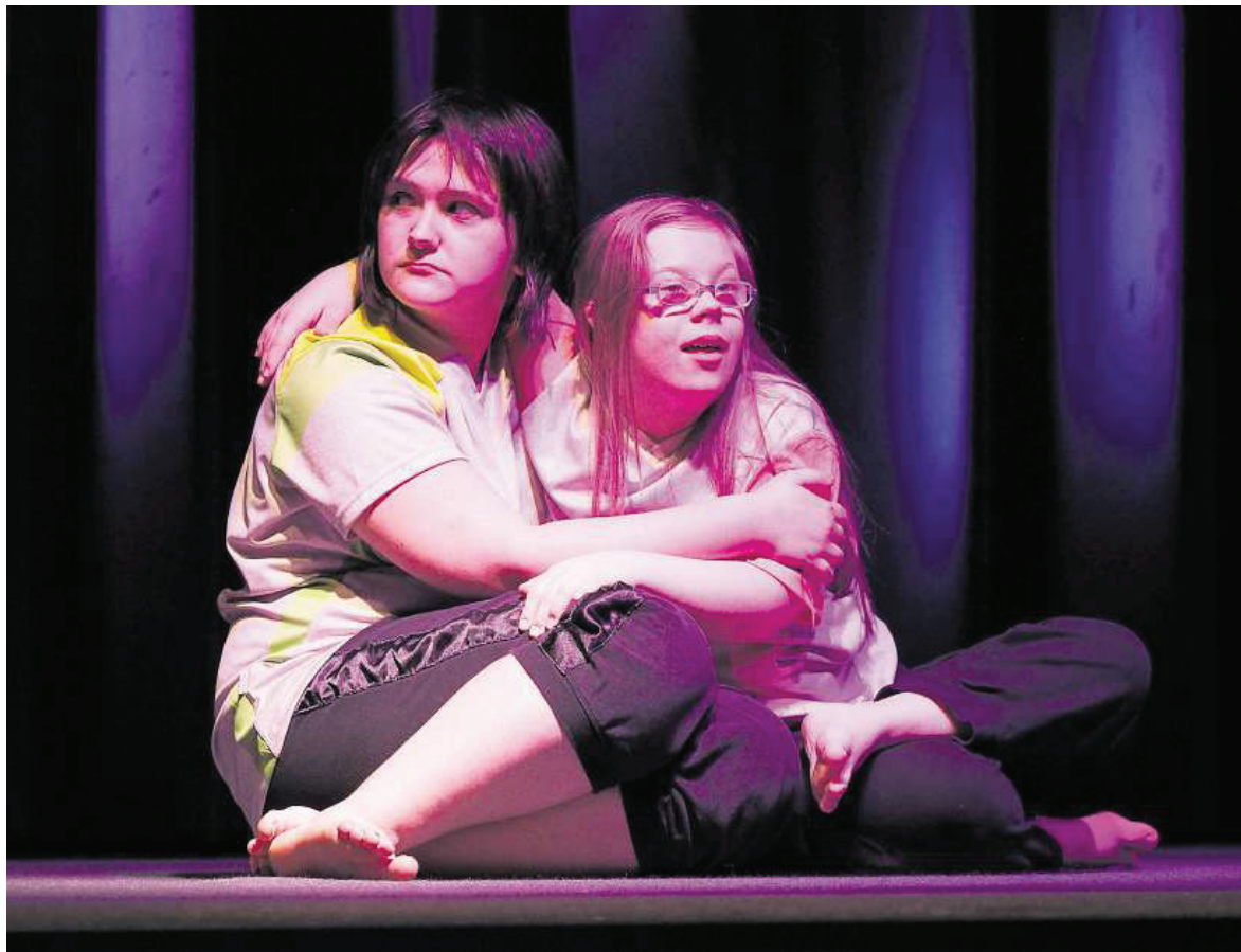
Begabte Tänzer der Bischof-Wittmann-Schule zeigten viel Gefühl.