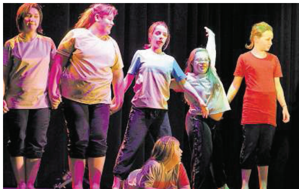
Die jungen Tänzerinnen boten eine gelungene Show.

In die richtige Show-Stimmung hatte das Publikum bereits zu Beginn der SV Fortuna mit seiner gelungenen